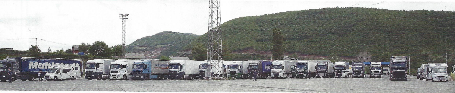
Platz für ein Gruppenbild: Der Warteplatz an der Grenze zwischen Mazedonien und dem Kosovo.

Die Spendenfahrten der Biker- und Brummihilfe e. V.