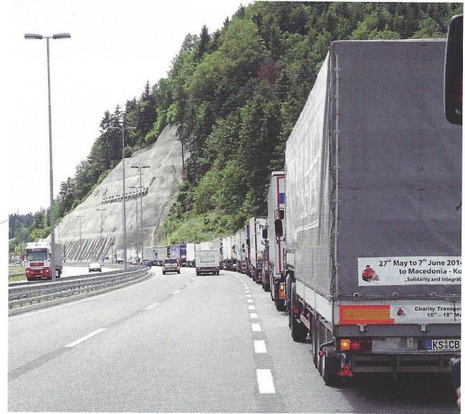
Der Konvoi am Grenzübergang von Slowenien nach Kroatien.